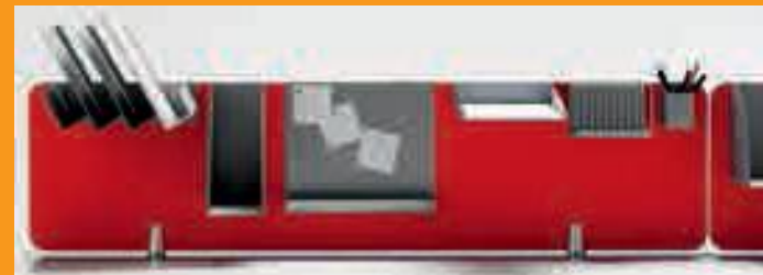
Accessori per "Frontal panel in melaminico" Accessories for "melamine frontal panels"