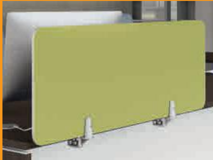
Frontal panel in melaminico sp. 1 cm Frontal panels in melamine 1 cm thick