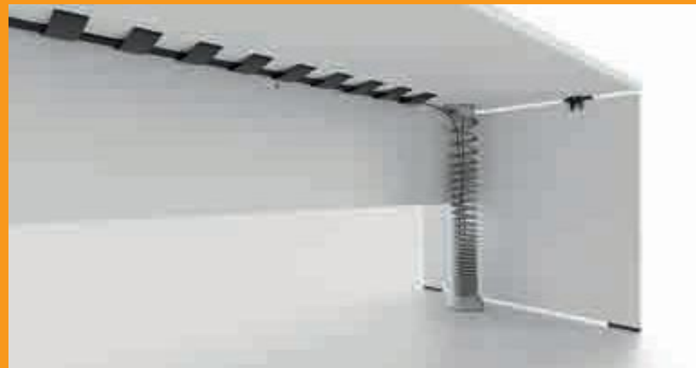
Canale + vertebra passacavi - Cable channel and vertebra