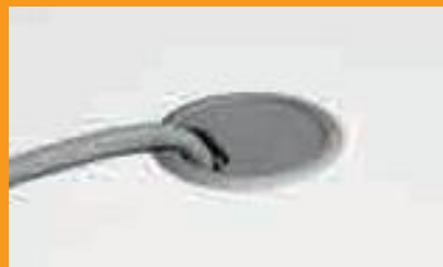
Tappi passacavi - Outlet lids